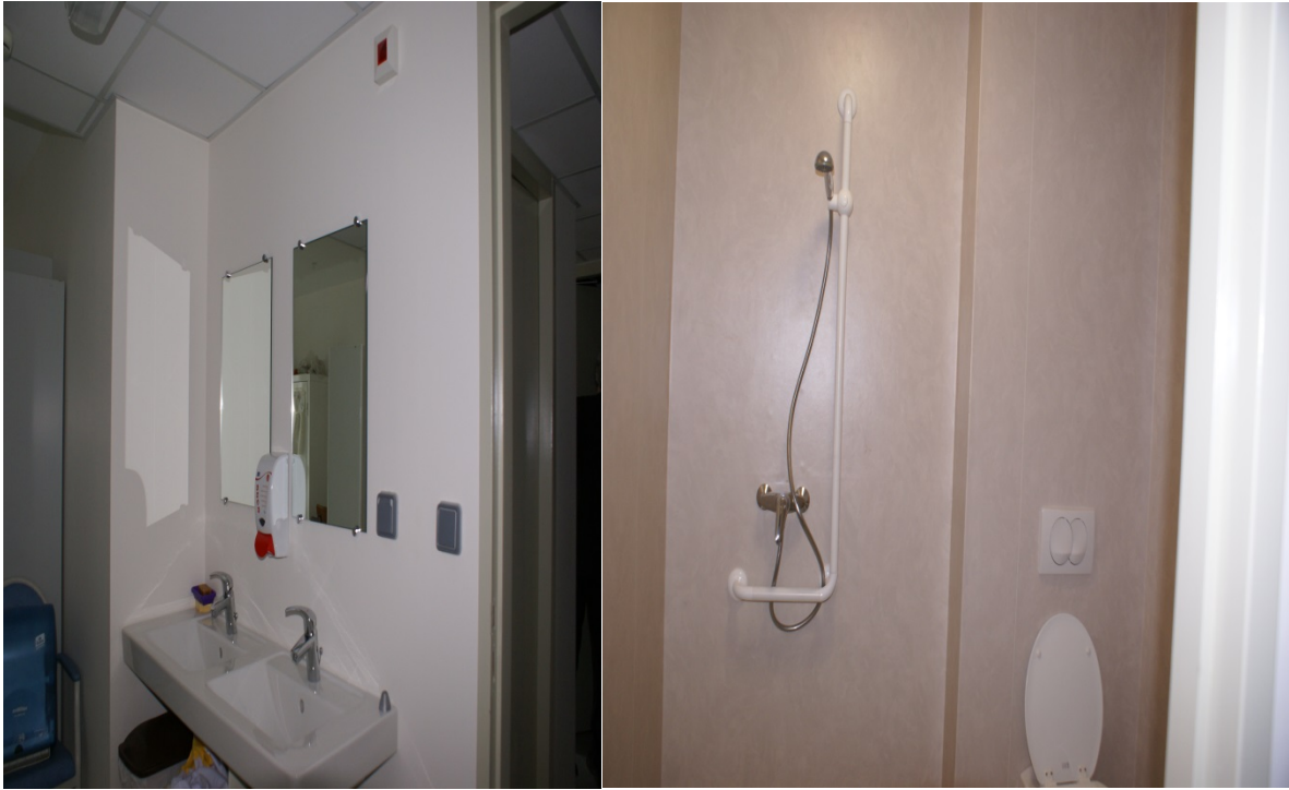
Vestiaires, sanitaires dédiés au personnel selon les normes en vigueur