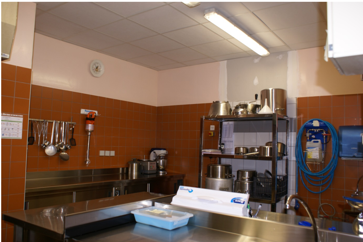
La cuisine déjà fonctionnelle