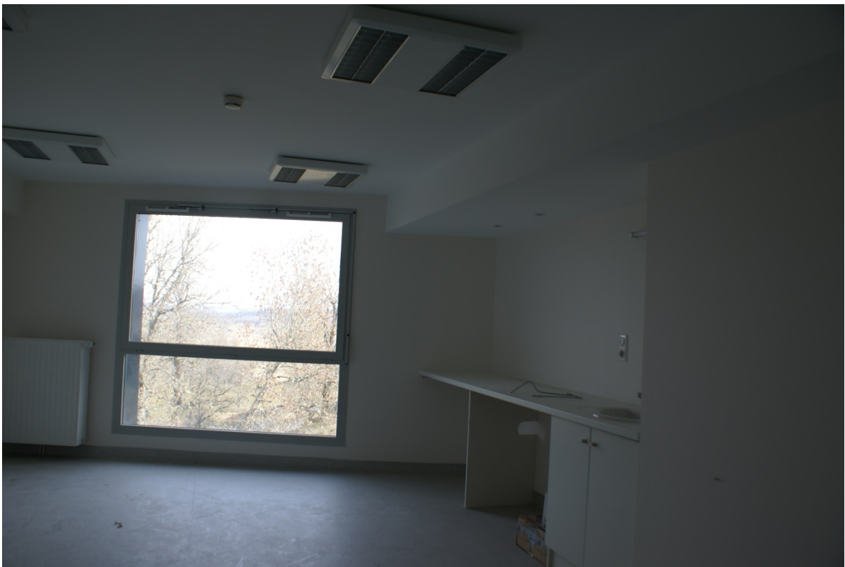
La consultation du Docteur ARMAND