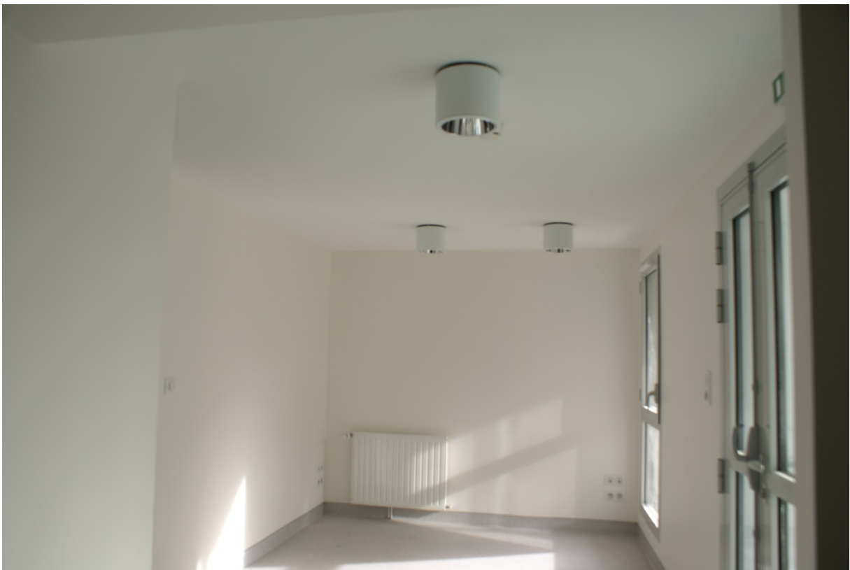
Le secrétariat (cloison vitrée prévue)