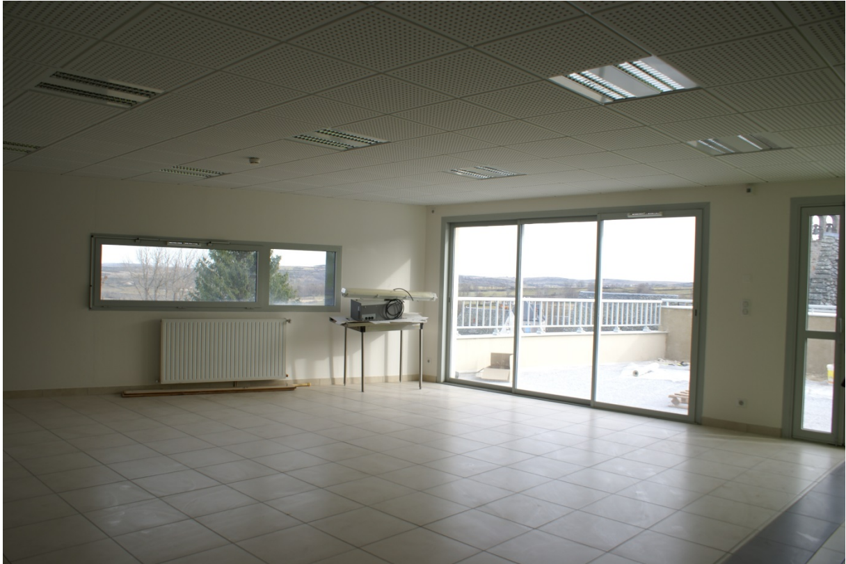
Salle à manger des résidents