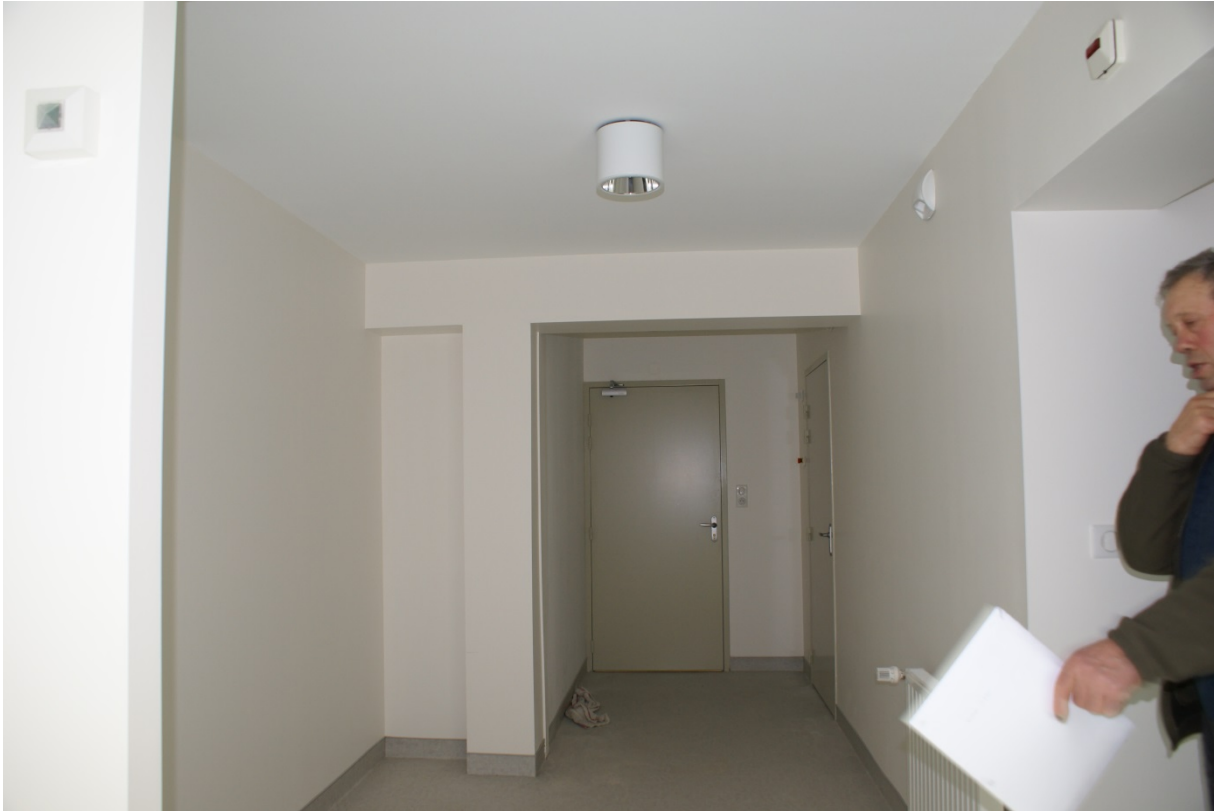
La salle d'attente