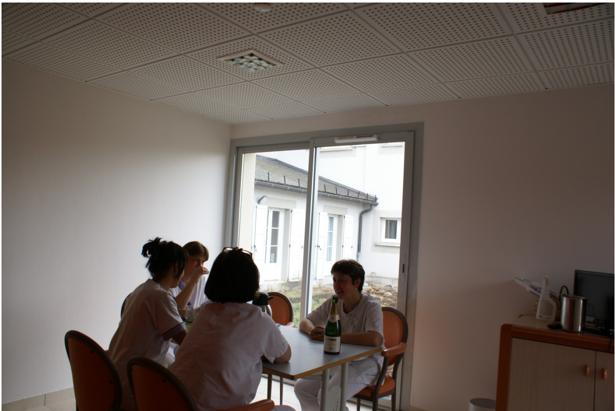
Salle à manger du personnel